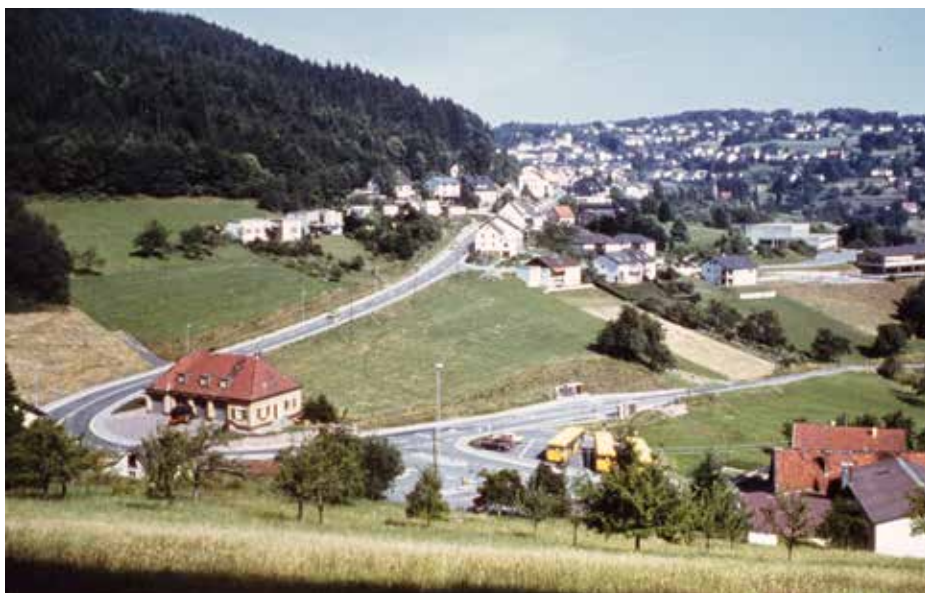
WILHELMSFELD IST SCHON IMMER GEPRÄGT DURCH EINE LOCKERE BAUWEISE. WENIGE BÜRGER MÜSSEN VIELE STRASSEN FINANZIEREN – HIER WILHELMSFELD 1980.

Für den Haushalt 2017 haben wir im Rahmen der Haushaltsberatungen einige Anträge eingereicht, die wir in einem Themenheft des Wilhelms darstellen wollen.