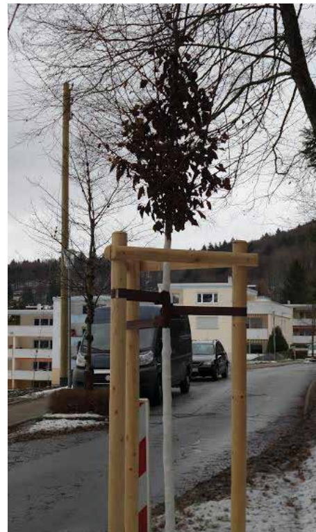
KEIN GUTES BEISPIEL FÜR VERKEHRSBERUHIGUNG

Ich hatte immer die Hoffnung, dass sich einmal die Einsicht durchsetzt, dass diese Art der Verkehrsberuhigung ein Fehler war, zumal der Hauptgrund für die Einrichtung war, dass sie bezuschusst wurde. Leider wurden Ende 2016 wurden zwei neue Bäume gepflanzt, davon einer unter einer Gruppe großer Bäume. In den 80er Jahren war es ein Versuch den Verkehr zu beruhigen, der Versuch ist aus meiner Sicht gescheitert.